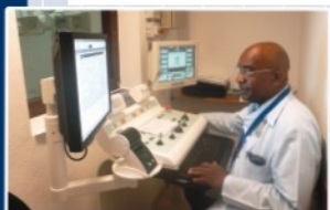
Un médecin surveillant de près ses appareils sophistiqués pendant les tests de santé obligatoires avant toute chirurgie.

CARDIOLOGIE • CHIRURGIE CARDIO-VASCULAIRE DERMATOLOGIE • GASTROENTÉROLOGIE HÉMATOLOGIE • ONCOLOGIE • OPHTALMOLOGIE ORTHOPÉDIE • OTO-RHINO-LARYNGOLOGIE (ORL) UROLOGIE